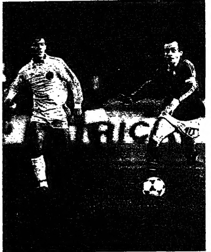
ميشال بلاتيني كبت منتخب فرنسا وسجل اصابتها مساهم اول من اسس يتخطى لاعب يوغوسلافيا فيرموزيك ليسجل الاصابة الثانية للفريق بلادم.

مضى ٥٦٩ دقيقة دون تحقيق هدف... وهذا وقت طويل لا سيما اذا كان الامر يتعلق بميشال بلاتيني. وكان افضل هداف فريق فرنسا قد جانيه التوفيق مع المنتخب الفرنسي منذ الدقيقة ٦٣ من مباراة فرنسا ويوغلافيا التي اقيمت منذ عام على نفس الملعب.